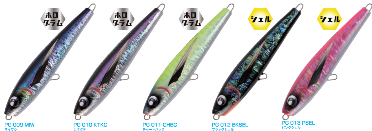
PG 009 MIW マイワシ

ウッドに樹脂素材を被せたハイブリッドアーとなります。ウッドだけでは表現できないボディ剛性を確保し樹脂素材による高い浮力とXESTA独自のウェイト配置により、あらゆるキャストでも飛行姿勢を崩すことなく安定した飛距離を確保することを可能にしました。これによりチャンスを逃すことなく確実に狙いのナブラへ送り込むことができます。アクションはウォブリングに近い移動距離の短くの広いS字スラロームアクションでフロントに配置したカップが水を噛み、ショートジャークでもロングジャークでもバランスを崩さずアクションしてくれる。このカップから生まれる細かい泡がボディを包みど派手なポップ音とマイクロバブルでマグロ類や大型青物を誘い出します。