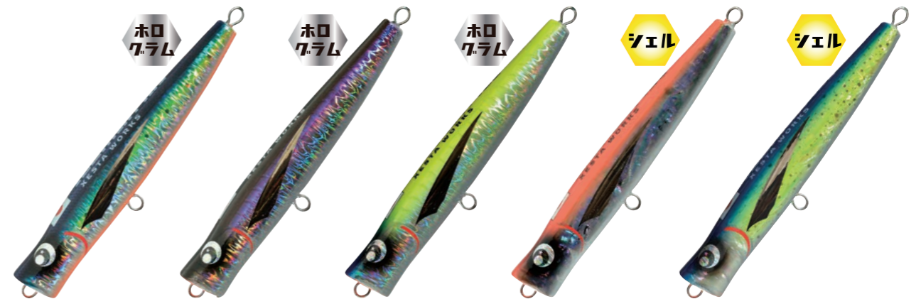
PG 017 MIWO マイワシオレンジペー